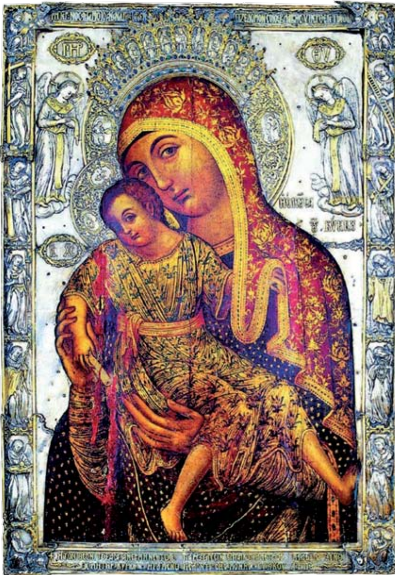
Μήτηρ Θεοῦ ἡ Ἐλεοῦσα τοῦ Κόκκου, εἰκονοστάσιον Καθολικοῦ Ἱερᾶς Μονῆς Κόκκου.