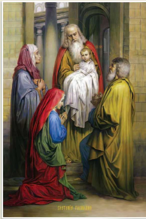
Η Υπαπαντή του Χριστού.

Θεολογίας Μοναχής (καθηγουμένης), Η Ορθόδοξη πρεσβυτέρα στη σκιά ή στο πλευρό του ιερέα; Βέροια (Παύλεια) 2011.