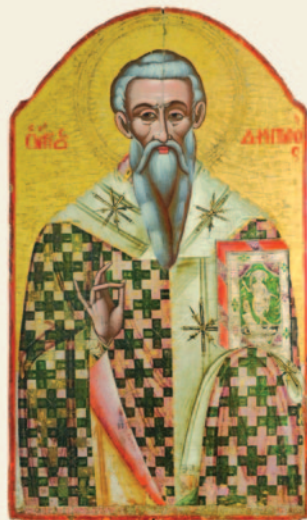
Η μνήμη του τιμάται στις 27 Ιανουαρίου

Το όνομα του αγίου Δημητριανού, ως επίσκοπου Ταμασέων, μαρτυρείται σε κώδικα της Μητροπόλεως Πάφου, στον οποίο αναγράφονται τα ονόματα των «Αγιωτάτων και Θεοφιλεστάτων επισκόπων τής Κύπρου Έπαρ-