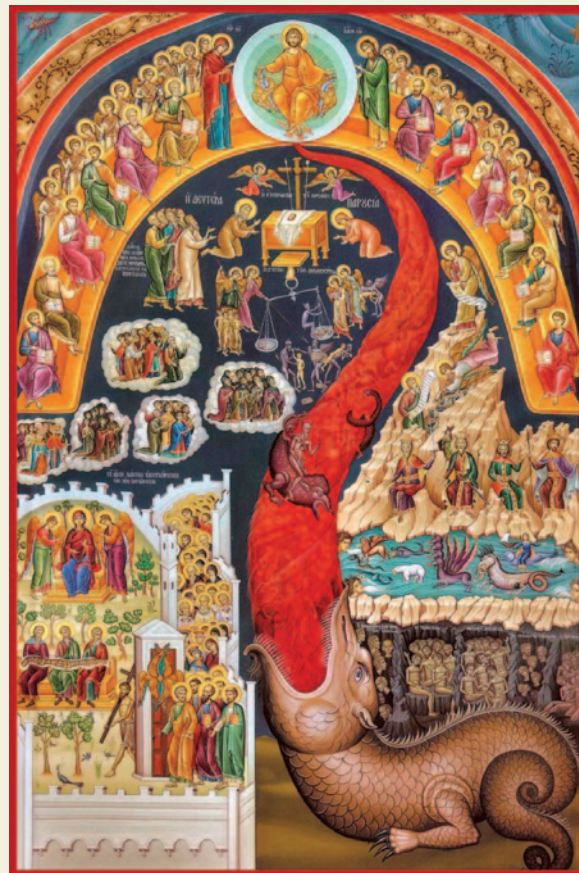
Ἡ μέλλουσα κρίση.