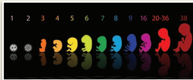
Η πορεία του εμβρύου.