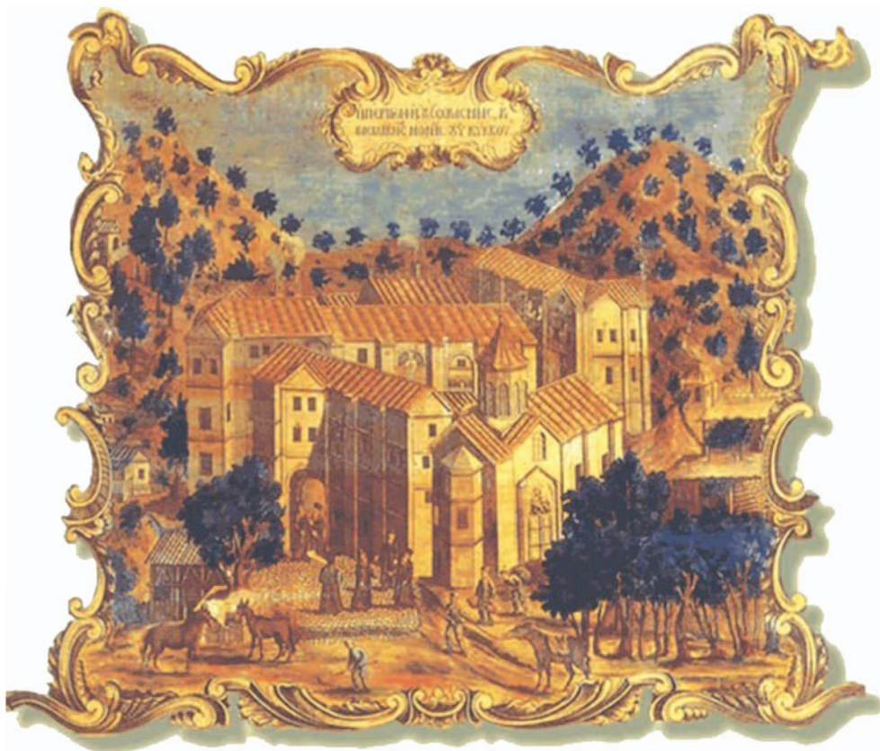
Τερά Μονή Κύκκου. Λεπτομέρεια ἀπὸ χαρακτηριστὸν τῆς Μονῆς, 1778.