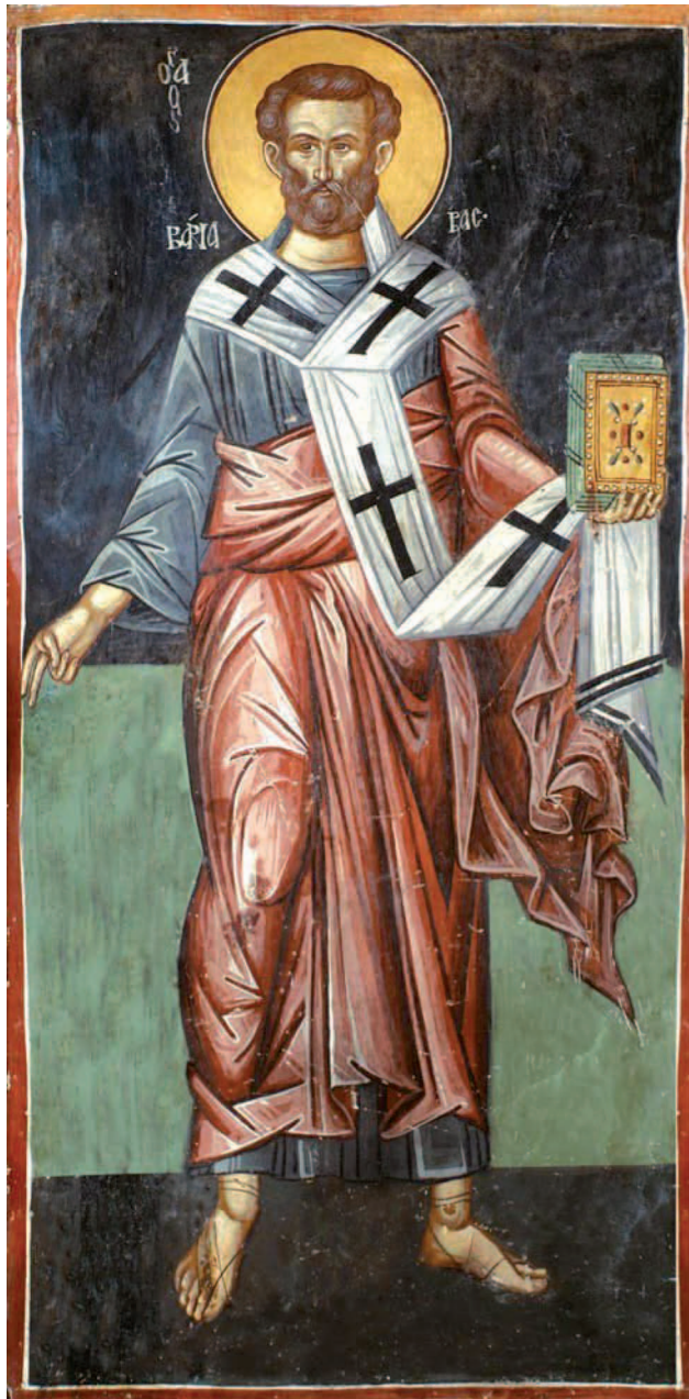
Ὁ Ἀπόστολος Βαρνάβας. Τοιχογραφία Ἱ. Μ. Παναγίας Χρυσοκουρδαλιωτίσσης, 16ος αἰών.