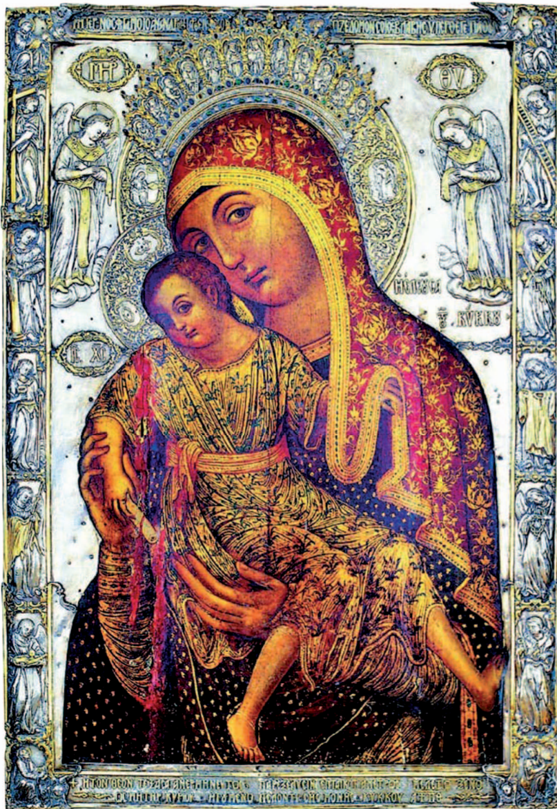
Μήτηρ Θεοῦ ἡ Ἐλεῦσα τοῦ Κύκκου, εἰκονοστάσιον Καθολικοῦ Ἱερᾶς Μονῆς Κύκκου.