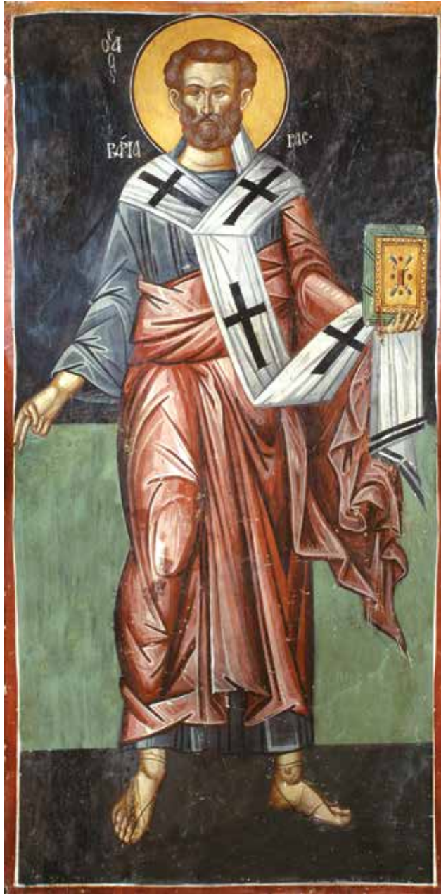
Ὁ Ἀπόστολος Βαρνάβας. Τοιχογραφία Ἱ. Μ. Παναγίας Χρυσοκουρδαλιωτίσσης, 16ος αἰών.