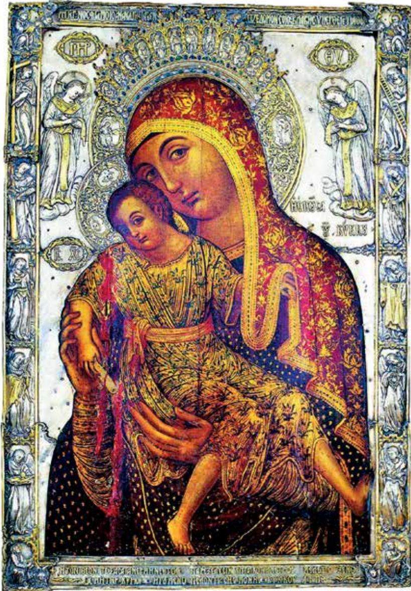
Μήτηρ Θεοῦ ἡ Ἐλεῦσα τοῦ Κύκκου, εἰκονοστάσιον Καθολικοῦ Ἱερᾶς Μονῆς Κύκκου.